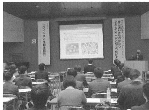
昨年のフォーラムの様子